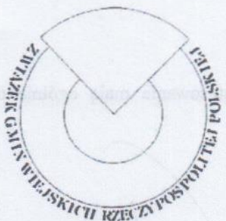
Logotyp monochromatyczny z napisami