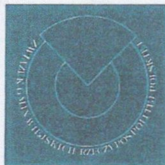
Logotyp monochromatyczny na ciemnym tle

Przewodnicząca XXXVI Zgromadzenia Ogólnego Związku Gmin Wiejskich Rzeczypospolitej Polskiej